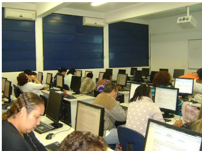
Agentes de saúde realizando as tarefas do curso no Laboratório de Informática da UNAERP

As atividades proporcionaram a Ribeirão Preto uma vasta atuação no campo da vigilância alimentar e Nutricional, além de um espaço para discussão e fortalecimento das ações em Segurança alimentar e nutricional para os multiplicadores que atuam diretamente em contato com a população.