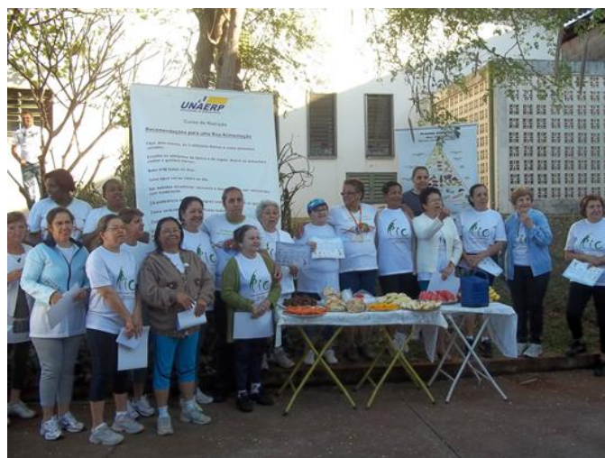
UBS Jd Zara