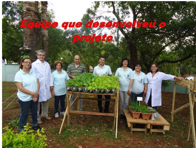
UBS Bonfim Paulista