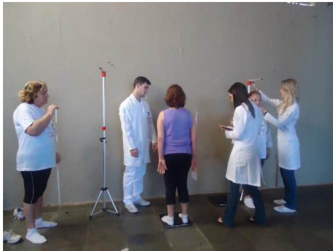
UBS São José