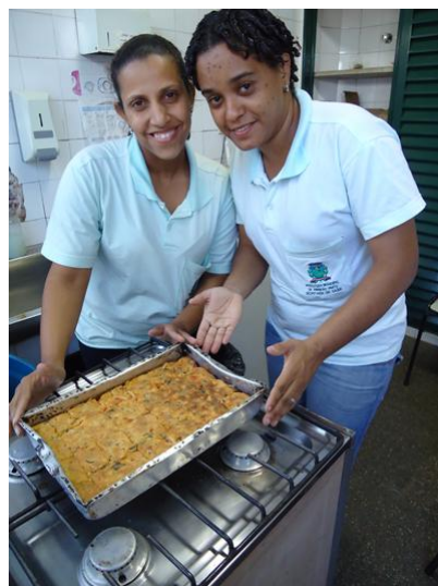
UBS Santa Cruz