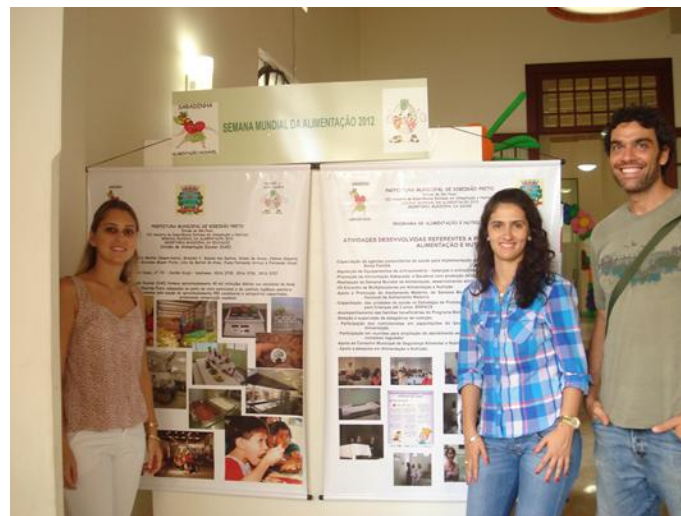
Ars e AL do município de Batatais durante o evento

Dois dos trabalhos desenvolvidos durante o curso foram apresentados no evento realizado em comemoração ao Dia mundial da alimentação promovido pela Secretaria da Saúde e Secretaria da Educação de Ribeirão Preto.