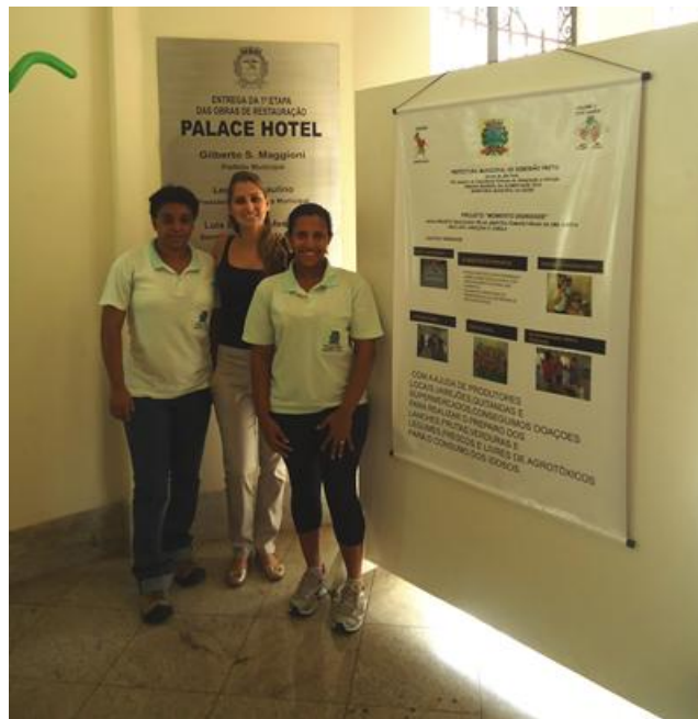
AR/Tutora do Interanutri e as agentes de saúde da UBS Santa Cruz apresentando o trabalho no evento.