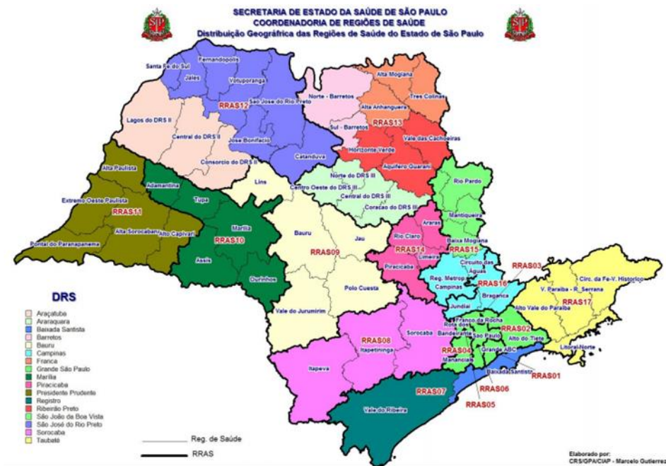
Figura 1: Configuração das RAS dentro das respectivas DRS no estado de SP, 2018.

Outro ponto considerado como relevante nos documentos dos organismos estaduais, para a organização das ações nas DCNT é a capacidade instalada de serviços que ofertam a apoio à diagnose e terapia. O estado de São Paulo possui o total de 5093, com distribuição nas 17 RAS.